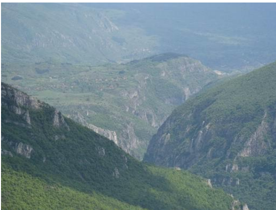
Сл. 3. Сићев. клисура – Градишћ. кањон