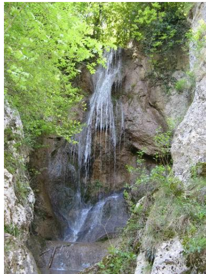
Сл. 4. Јелашничка клисура – водопад Рипаљка

„ Упознај отаџбину својих предака да бисте је више волели “ „ Сачувајмо ретке и ендемичне биљке у парковима природе – Стара планина, Јелашничка и Сићевачка клисура “