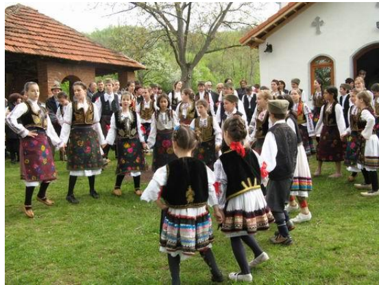
Сл. 2. Црква Св. Петар и Павле – Ускрс 2009.